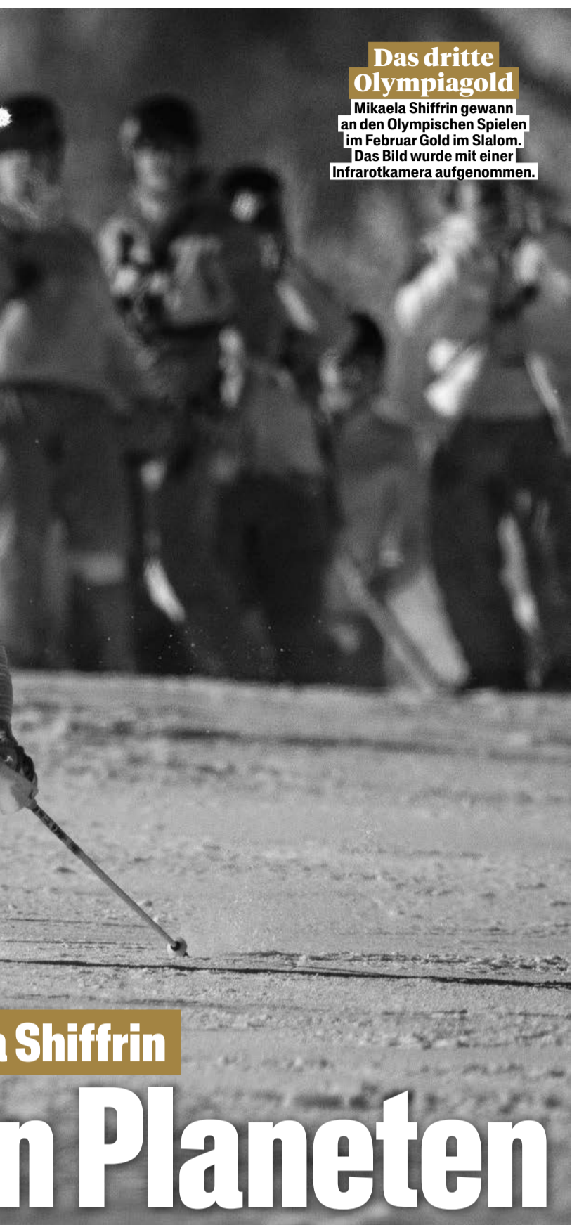
Das dritte Olympiagold Mikaela Shiffrin gewann an den Olympischen Spielen im Februar Gold im Slalom. Das Bild wurde mit einer Infrarotkamera aufgenommen.